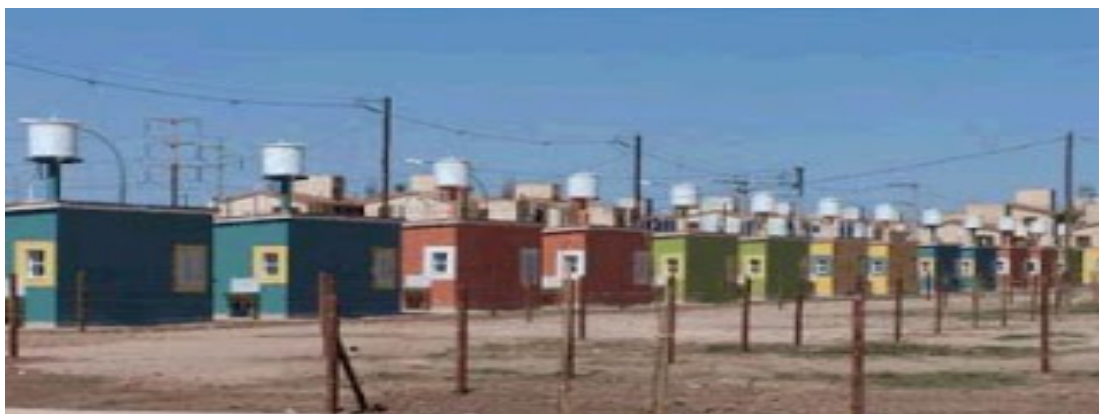
Fotografía de viviendas construidas en las ciudades barrios.