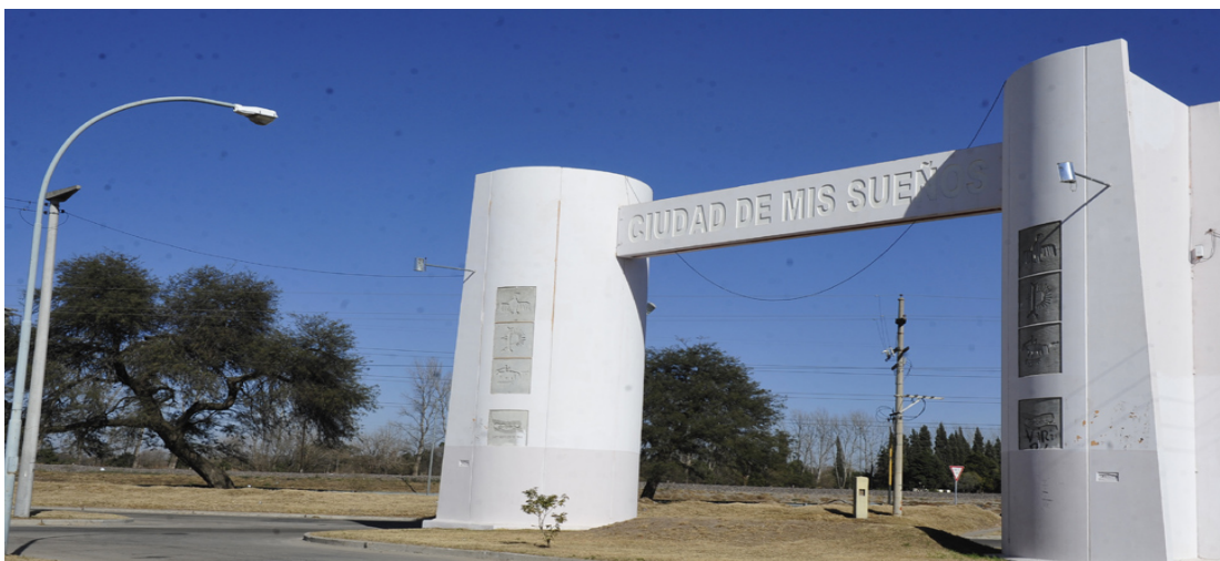
Fotografía de la fachada de entrada al barrio “Ciudad de mis Sueños”.

Las viviendas individuales constan de una cocina comedor, dos dormitorios y un sanitario, un total de superficie cubierta de 42 m2 y están distribuidas de manera ordenada en el territorio; fueron concedidas bajo la modalidad de “llave en mano”, el habitante de la misma en ningún momento tuvo participación en la elección y proceso de construcción hasta el día de la entrega. Estas unidades habitacionales fueron muy económicas y cumplieron los aspectos básicos de una vivienda, aunque su tamaño es muy reducido y no llega a satisfacer las necesidades de las familias trasladadas.