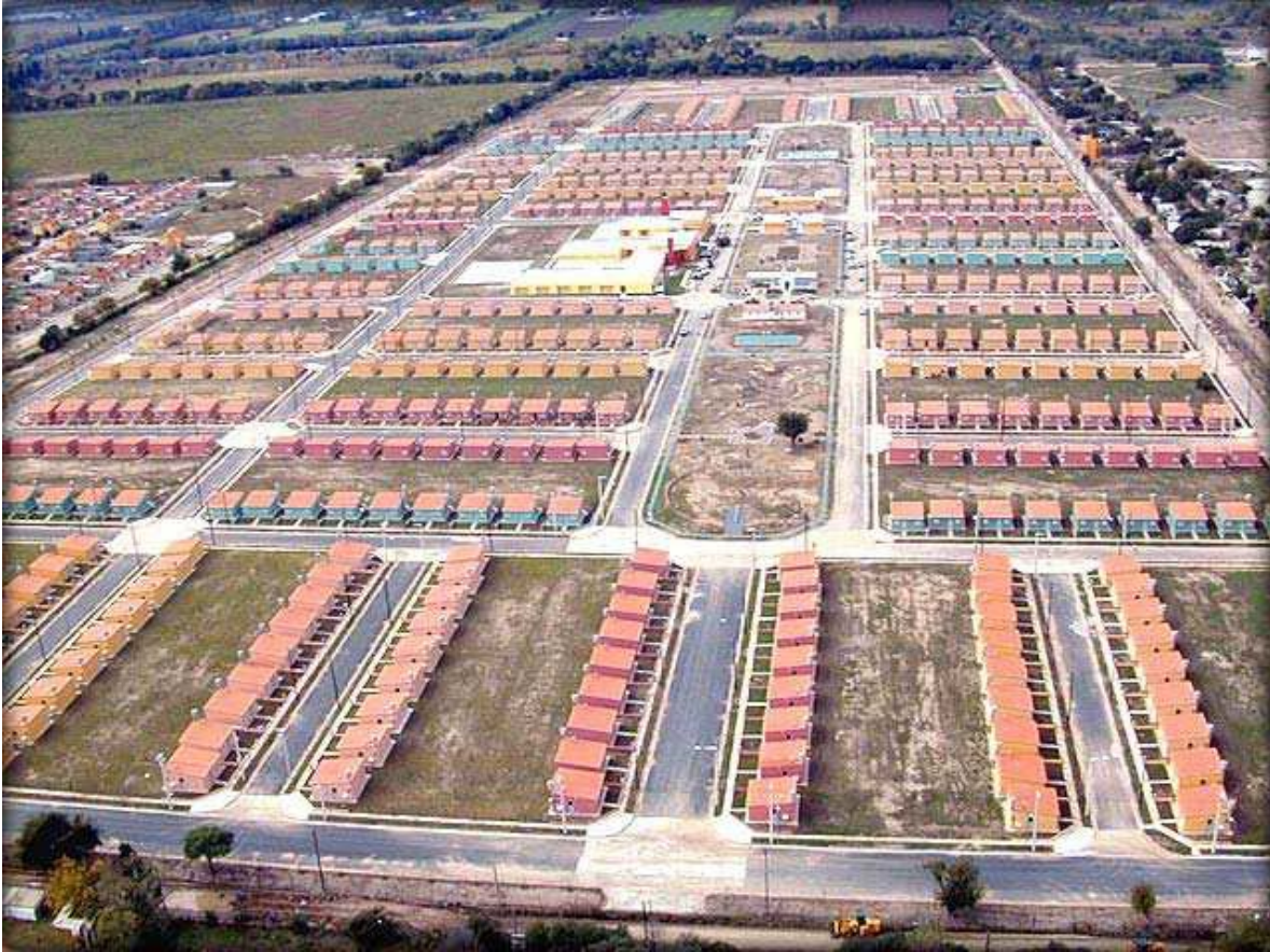
Fotografía de Imagen aérea de uno del barrio-ciudad.

Fuente: CISTERNA, Carolina (2011): “Aproximaciones al proceso de producción de espacio. El caso del barrio “Ciudad de mis sueños”. Trabajo final para aspirar a la Licenciatura en Geografía. Pág. 38 Universidad Nacional de Córdoba.