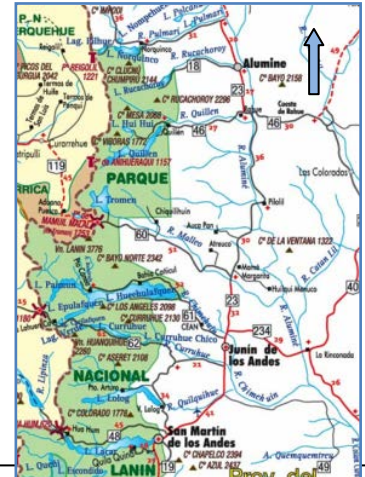
Mapa N°3. Parque Nacional Lanín.