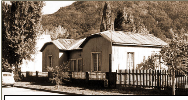
Foto 1.Casa de la Familia Raguzzi..Año1930.Corresponde a la etapa de los colonos galeses.

La actividad turística jerarquiza a San Martín de los Andes y lo posiciona en los grandes centros urbanos emisores de turistas. Se impulsa el mejoramiento de la capacidad hotelera mediante el crédito y otros beneficios. Como consecuencia, a mediados de los 80 se produce un notorio incremento en la capacidad hotelera y un crecimiento poblacional significativo.