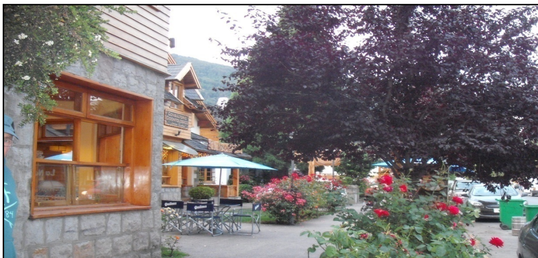
Foto 2. Madera, piedra, vidrio, flores, chalets alpinos circundados por bosques y montaña hacen del lugar una zona privilegiada. Año 2015

Impactantes hoteles cinco estrellas, hosterías y cabañas se distribuyen armónicamente aprovechando el entorno natural, conjugando la belleza de éste con cuidados jardines ornamentales.