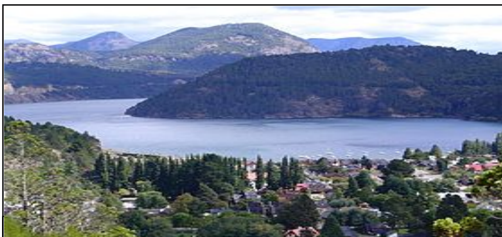
montañas del fondo se encuentra la hermana República de Chile.

El lago presenta algunas islas, como la Isla Santa Teresita, Isla de Los Patos y la conocida Islita frente a la playa de Trompul.