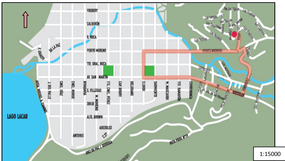
Mapa N°4. Ejido urbano, circuitos al cerro Chapelco y al lago Lolog. Fuente: Dirección de Turismo de San Martín de los Andes.