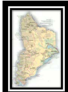
Mapa N°2. Detalle de la provincia de Neuquén.