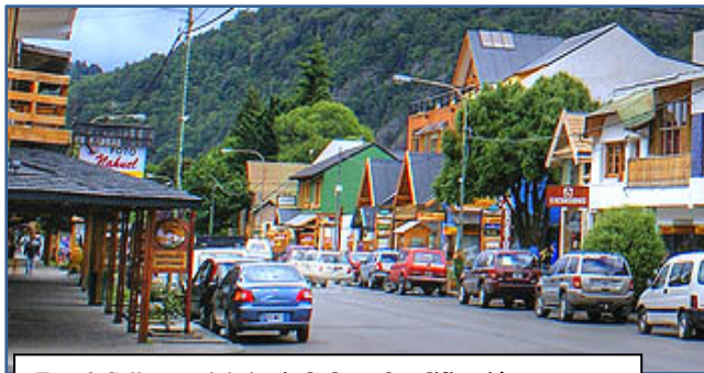
Foto 2.Calle actual de la ciudad con la edificación integrada al paisaje.

La actividad turística jerarquiza a San Martín de los Andes y lo posiciona en los grandes centros urbanos emisores de turistas. Se impulsa el mejoramiento de la capacidad hotelera mediante el crédito y otros beneficios. Como consecuencia, a mediados de los 80 se produce un notorio incremento en la capacidad hotelera y un crecimiento poblacional significativo.