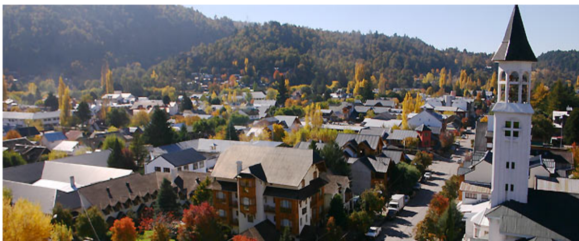
Foto 3. Centro Cívico y construcciones típicas de la zona. Fuente : foto tomada por la autora. 2015

Se encuentra a 41 Km de Junín de los Andes, por la ruta Nacional N° 40 y a 107 Km de Villa La Angostura, por la misma ruta, ciudades que se ubican al noreste y sur, respectivamente.